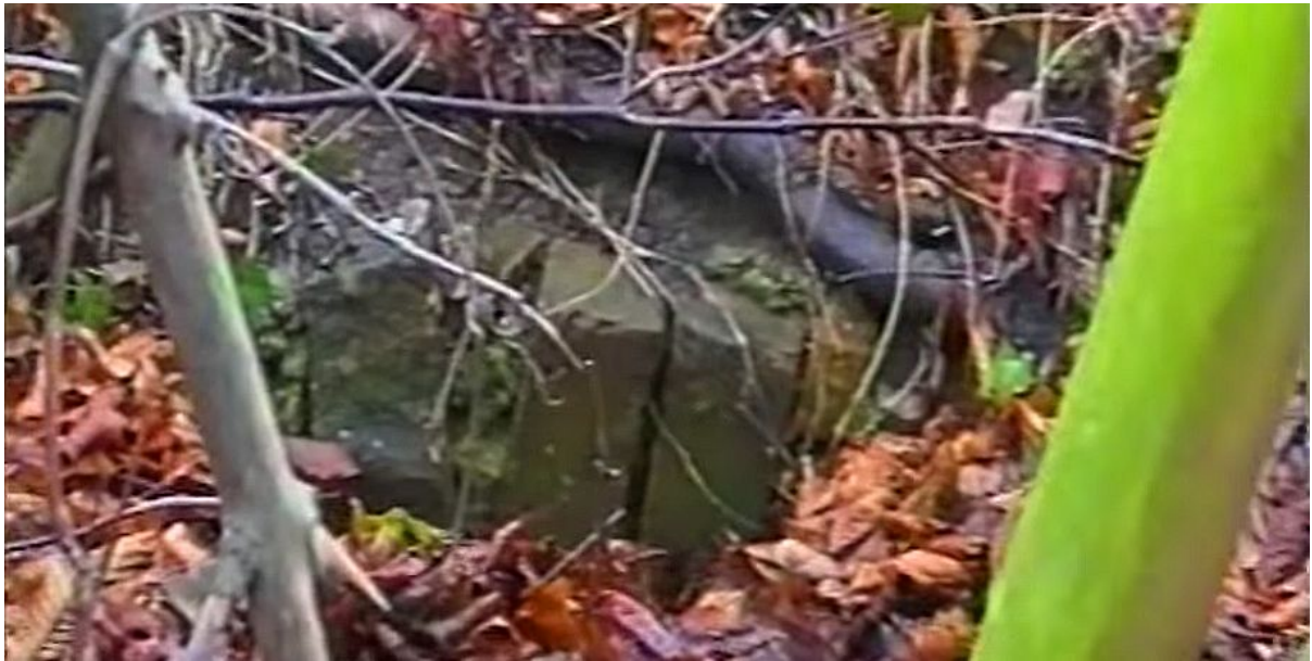
materiał wideo VHS, 1998 rok