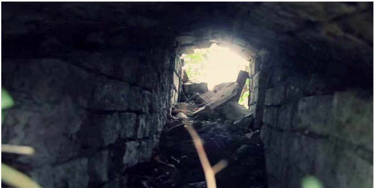
material wideo HD, 2014 r.