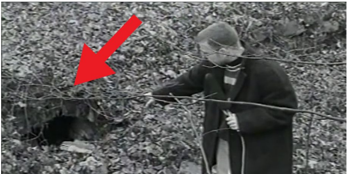
materiał wideo VHS, 1998 rok