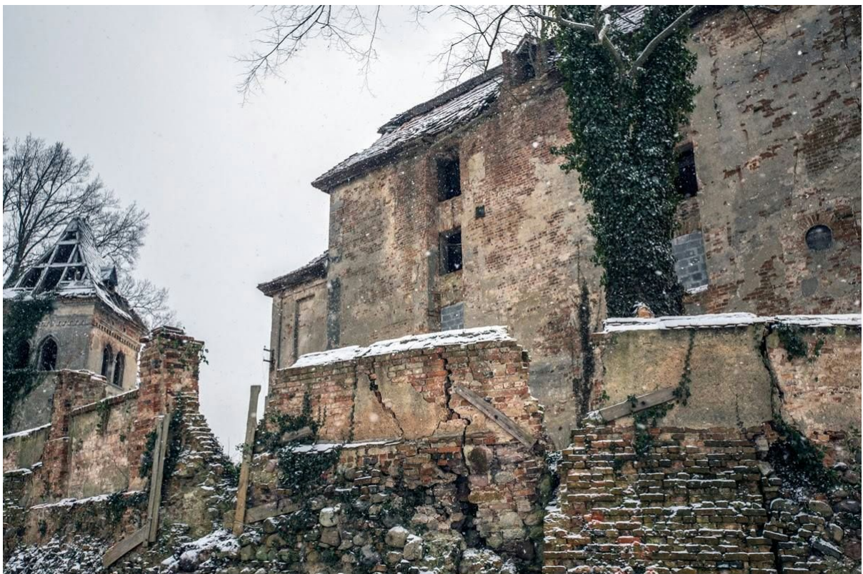
możliwość wejścia na teren obiektu, luty 2015 r.