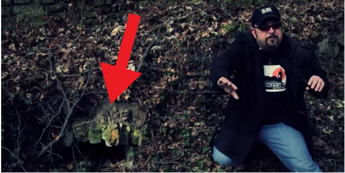
material wideo HD, 2014 r.