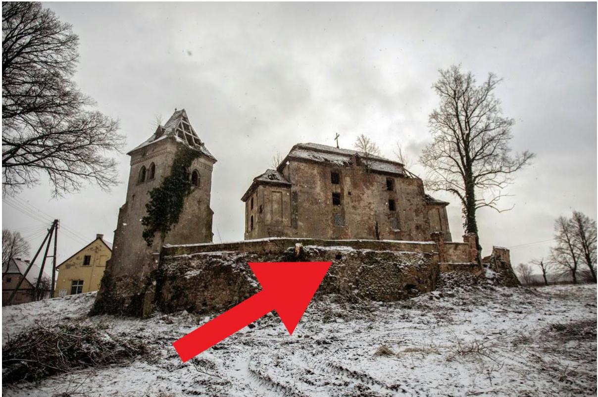
okno widoczne z zewnątrz zimą, luty 2015 r.