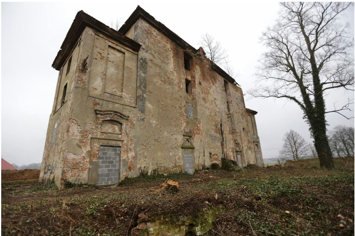
nadesłane zdjęcie zrobione ze środka zapadliska, luty 2015 r.

Brak jakichkolwiek informacji na temat stowarzyszenia, a także fakt, iż nie legitymuje się ono długim czasem działalności, bowiem zarejestrowane zostało w KRS 12 września 2014 roku, osiem dni po naszej interwencji w Polskim Radiu Wrocław , każe nam powątpiewać, czy obecny właściciel ma wystarczające doświadczenie w zabezpieczaniu zabytków. Tym bardziej, iż otrzymaliśmy zdjęcia dokumentujące, iż wstępne zabezpieczenie obiektu nie zminimalizowało możliwości bezprawnego wejścia na teren zapadliska i prowadzenia przez nieuprawnionych poszukiwaczy prac niezgodnych z prawem.